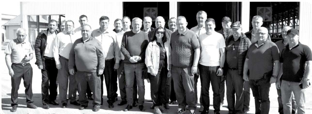
Участники объезда на МТК в станице Суворовской.

Осмотрев посевы ПАО «Винсадское», делегация аграриев побывала в Винсадах на предприятии по производству мультизлаковых конфет на основе овсяной, пшеничной, ку-