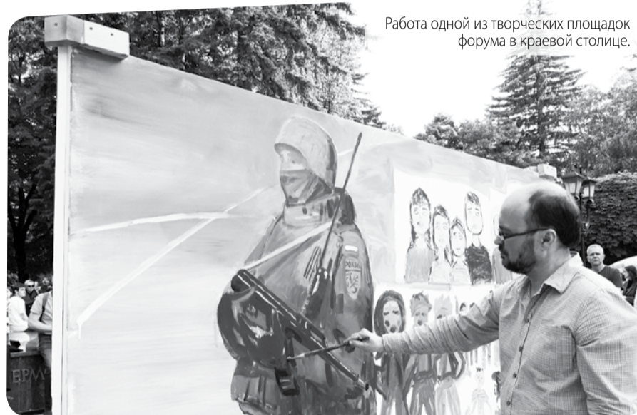
Работа одной из творческих площадок форума в краевой столице.

В Ставрополе прошёл VIII Международный форум творческих союзов «Белая акация». Ежегодный фестиваль искусств длился с 10 по 14 июня. Он подарил жителям и гостям краевой столицы множество творческих мастер-классов, перформансов, выставок, выступлений, лекций.