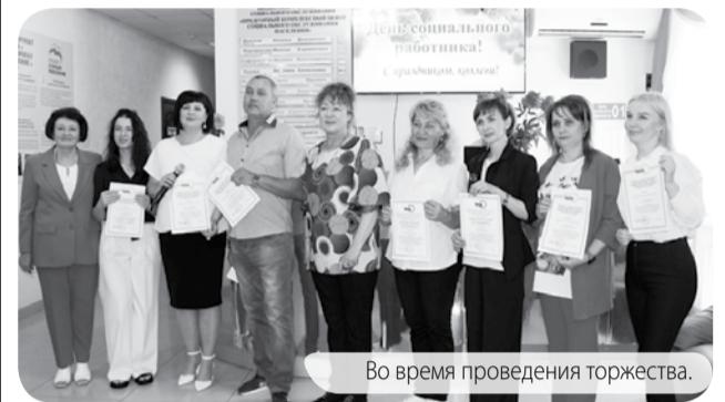
Во время проведения торжества.

В потоке будней профессиональный праздник становится ярким маяком, который указывает ценность служения профессии и её нравственные основы.